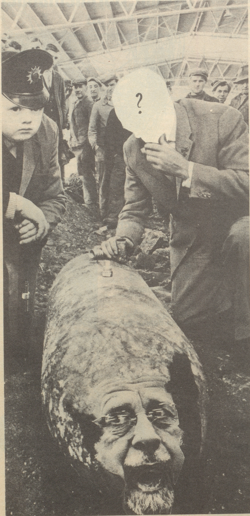
Wer wird diesen Blindgänger entschärfen?! —