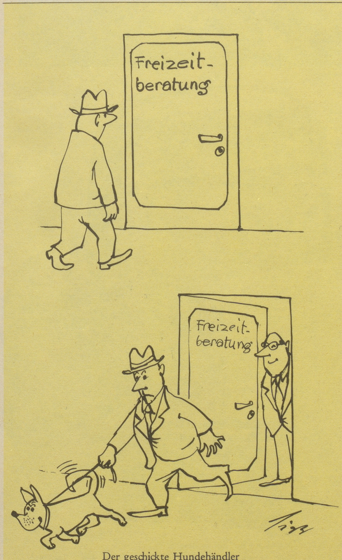
Der geschickte Hundehändler

Diäten Fr. 64.– plus 50 für die Marke plus Verschleiß von zwei Urlaubstagen.