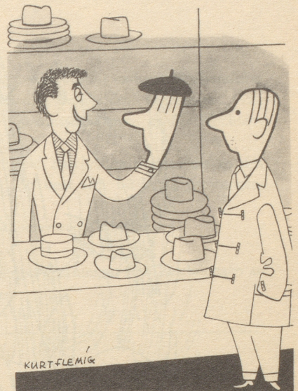
«Sehen Sie, so wird Ihnen diese Mütze stehen!»

Erich Mende als dritter Mann am Verhandlungstisch, das war das Ziel der Krämpfe während der Koalitionsverhandlungen. Aber dieser Traum war schnell ausgeräumt. Adenauer nahm nur seine beiden engsten Berater Schröder und Strauss mit.