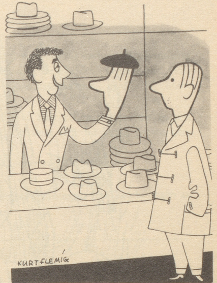
«Sehen Sie, so wird Ihnen diese Mütze stehen!»

Erich Mende als dritter Mann am Verhandlungstisch, das war das Ziel der Krämpfe während der Koalitionsverhandlungen. Aber dieser Traum war schnell ausgeräumt. Adenauer nahm nur seine beiden engsten Berater Schröder und Strauss mit.