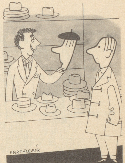
«Sehen Sie, so wird Ihnen diese Mütze stehen!»

Erich Mende als dritter Mann am Verhandlungstisch, das war das Ziel der Krämpfe während der Koalitionsverhandlungen. Aber dieser Traum war schnell ausgeräumt. Adenauer nahm nur seine beiden engsten Berater Schröder und Strauss mit.