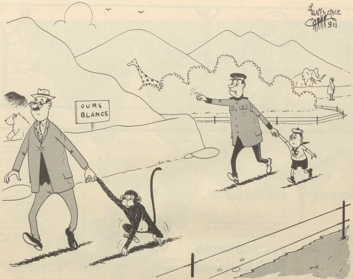
«Halt - es isch de Lätz!»