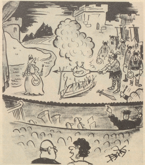
«Es ist die letzte Lohengrin-Vorstellung der Saison, sie brauchen nun den Schwan nicht mehr!»

Dem gescheiten kleinen Druckfehlerteufel des «Alg. H'blad», der uns zu dieser kleinen Exkursion ins sogenannte «liberalisierte» Polen Gelegenheit gab, ein dank je wel! Um aber doch nicht ganz ohne Perspektiven zu endigen: Jenen Freunden in Polen, die gefangen hinter vergitterten Fenstern oder außerhalb der Eisenstäbe in steter Bedrängnis leben müssen, sich vergeblich nach einer Freiheit sehnd, in der ständig zu atmen, die unangestastet und gesichert zu besitzen wir das Glück haben ... jenen Freunden (die nichts mit den Verrätern am polnischen Volk gemein haben wollen, die, von einem Gomulka gesandt, unter allerlei Vorwänden bei uns im Westen herumlungern) ... ihnen rufen wir zu: Noch ist Polen nicht verloren .. trotz Gomulka, trotz PPR, trotz der Sowjetunion .. weil es euch gibt, Ihr Tapferen! Wir danken euch! Pietje