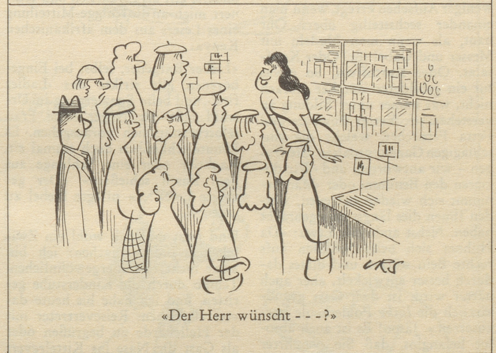
«Der Herr wünscht - - -?»

hoch angesehen war, sie solle doch zu Hof gehn, um ein gutes Beispiel zu geben. «Ich habe ein besseres Beispiel», sagte sie, «wenn ich mich vom Hof fernhalte.»