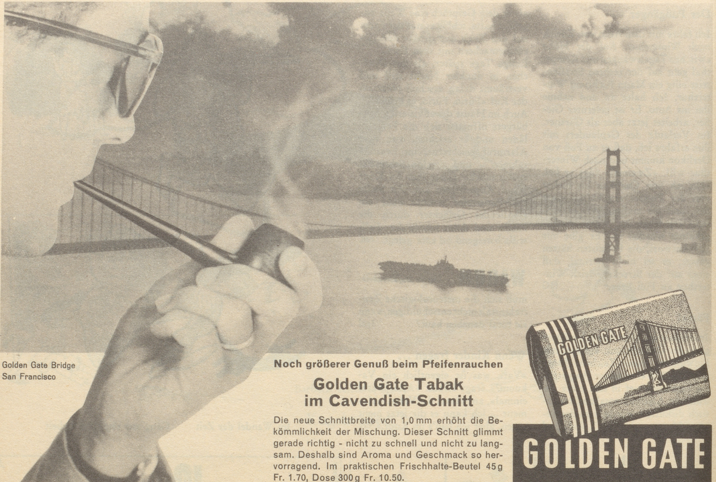
Golden Gate Bridge San Francisco