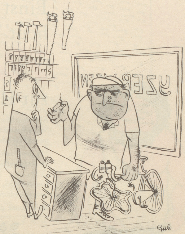
« -- und ußerdem en Nagel! »

In Atlanta kam ein Bub in den Drugstore, kaufte eine Kleinigkeit und bezahlte mit einem Zehndollar- schein. Der Verkäufer gab ihm den Schein zurück und sagte: «Damit hat man deinen Vater angeschmiert – der Schein ist falsch.» – «Wieso falsch?» entrüstete sich der Junge. «Mein Daddy macht sie doch selbst!» – So fing man Jack Mills, einen Notenfälscher, den die Polizei seit Jahren gesucht hatte. *