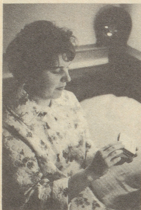
LAEVORAL verschafft rasch neue Kräfte

wertvoller Energiespender für Automobilisten