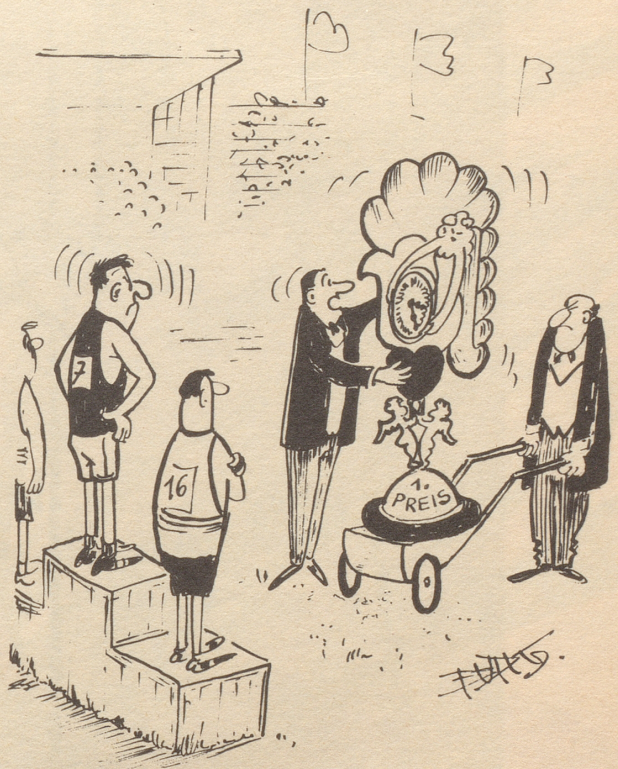
«Er sagt, eine Armbanduhr wäre ihm lieber!»