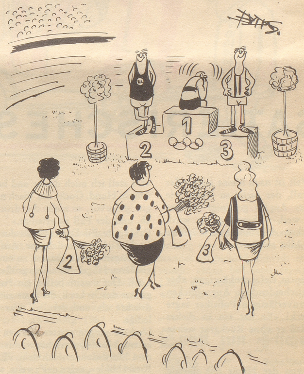
Kurz vor dem Siegeskuß

nen zur Aufnahmeprüfung, bald besser, bald weniger gut vorbereitet. Zur Vorbereitung gehört auch, was eine Lehrkraft an einer Bezirksschule ihren Schülerinnen zu sagen pflegt: «Wenn ihr nach Aarau ins Seminar kommt, werdet ihr