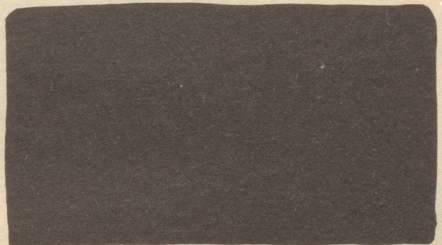
«Murre nicht Sieghilde, - schließlich wollen die Leute im Elektrizitätswerk auch ihr freies Wochenende!»