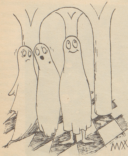
«Ich glaube, der ist nicht echt!»