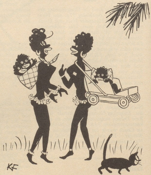
«Bekommt ihr denn noch keine Entwicklungshilfe?»

Ein junger Maler stellt aus: «Was kostet die Landschaft da?» «Siebzig Franken.» «Was? – Dafür bekomme ich ja ein Paar Schuhe!»