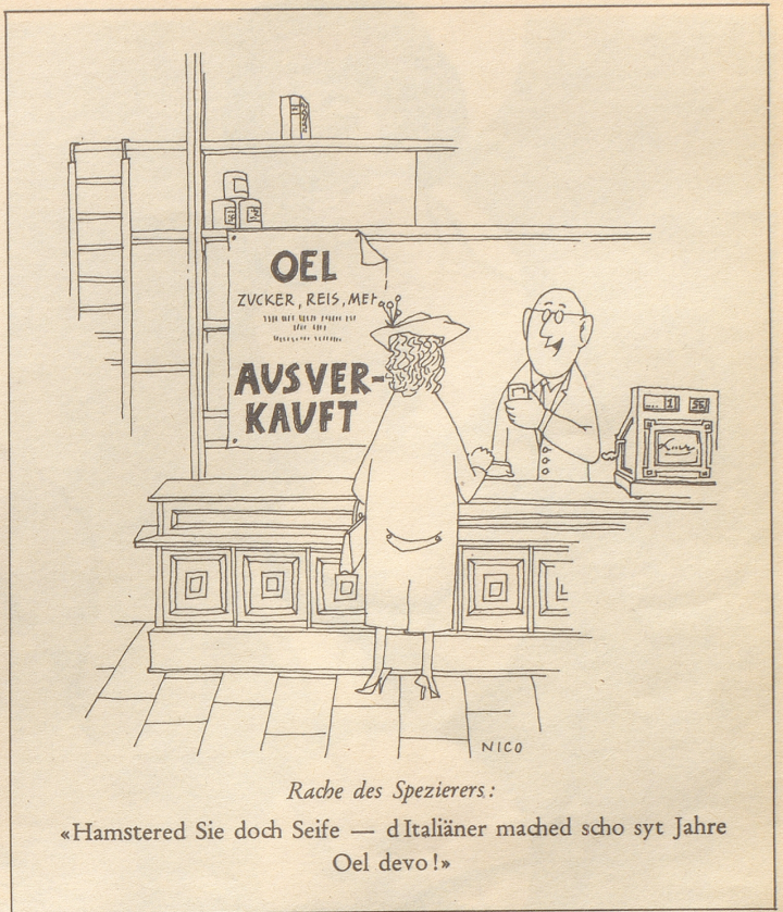
Rache des Spezierers: «Hamstere Sie doch Seife — dItaliäner mached scho syt Jahre Oel devo!»