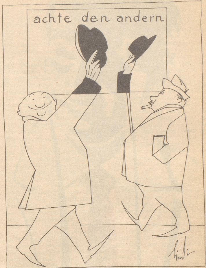
Der Herr rechts: «Settig Hüet hei nume die Mehbessere!»

Bezugsquellennachweis: E. Schlatter, Neuchâtel