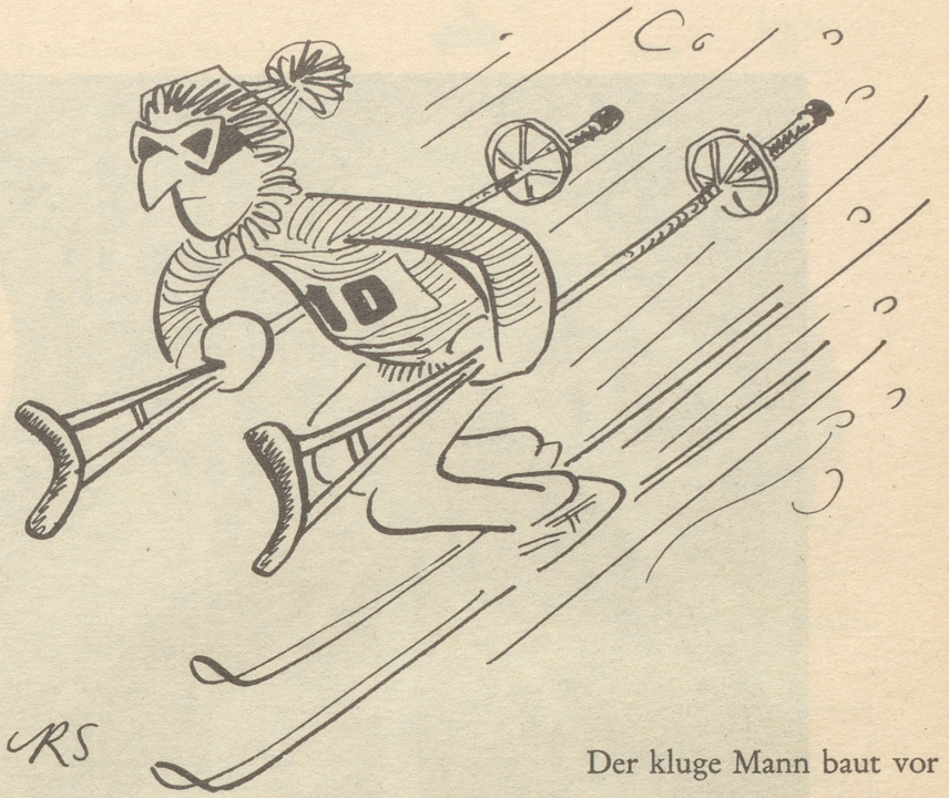
Der kluge Mann baut vor

Und das gedacht: Blühender Osthandel mit – Schmalz. Kobold