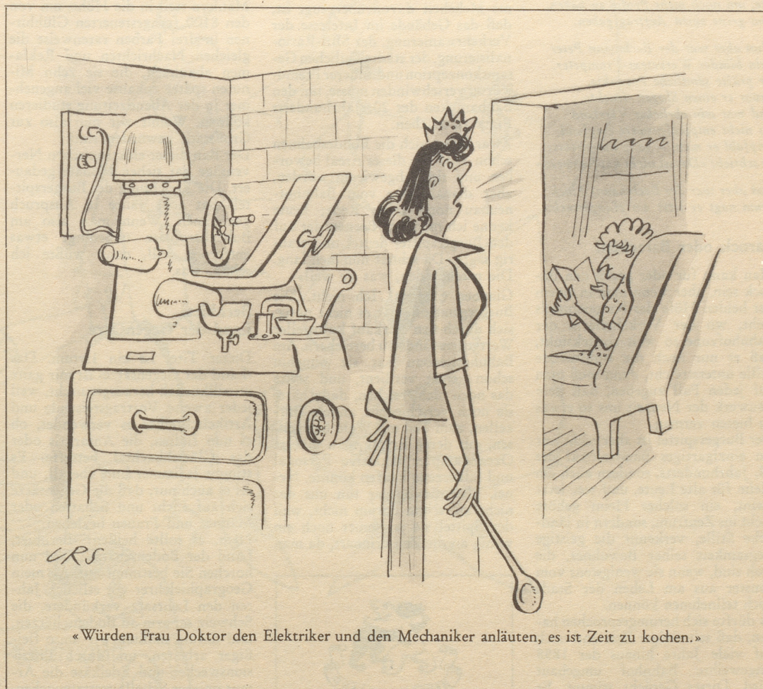
«Würden Frau Doktor den Elektriker und den Mechaniker anläuten, es ist Zeit zu kochen.»