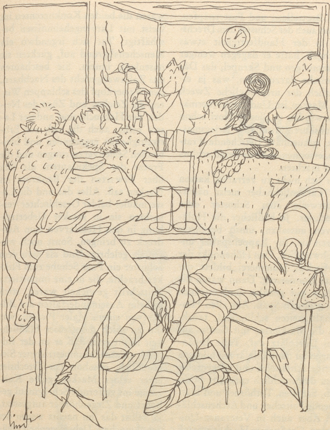
«Weisch wa mir so gfallt a Dir? Du häsch di gliich Figur wie n ich!»