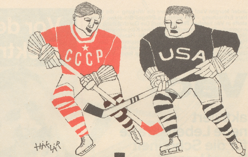
Der kalte Krieg