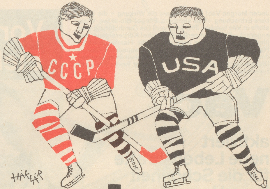
Der kalte Krieg