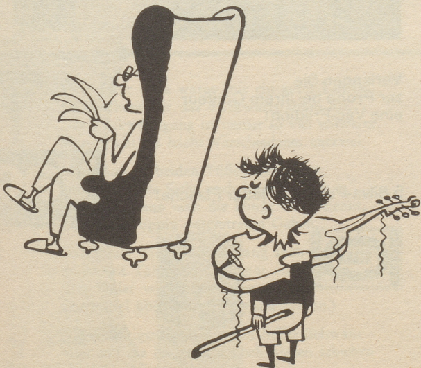
«Und - isch Din Gügelehrer mit Dir zfride?»