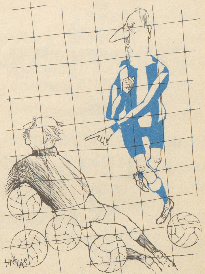
Durch die 5 : 2-Niederlage gegen Frankreich ist England aus den Spielen um den Europacup der Nationen ausgeschieden.

Es ist noch immer wahr: Der Westen hat nichts zu fürchten außer seiner eigenen Furcht, solange er seine Ideale nicht verrät. AbisZ