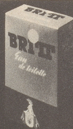
BRITT Eau de Toilette 80°