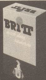
BRITT nach dem Rasieren