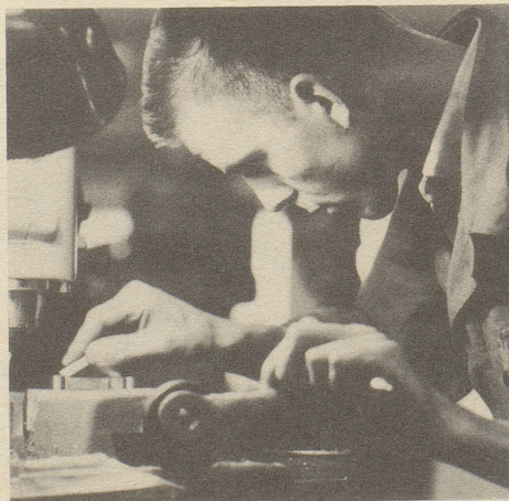
Konzentrieren heisst Ausschalten dessen, was von der Hauptsache ablenkt. Ovomaltine stärkt und erhöht die Konzentrationsfähigkeit.