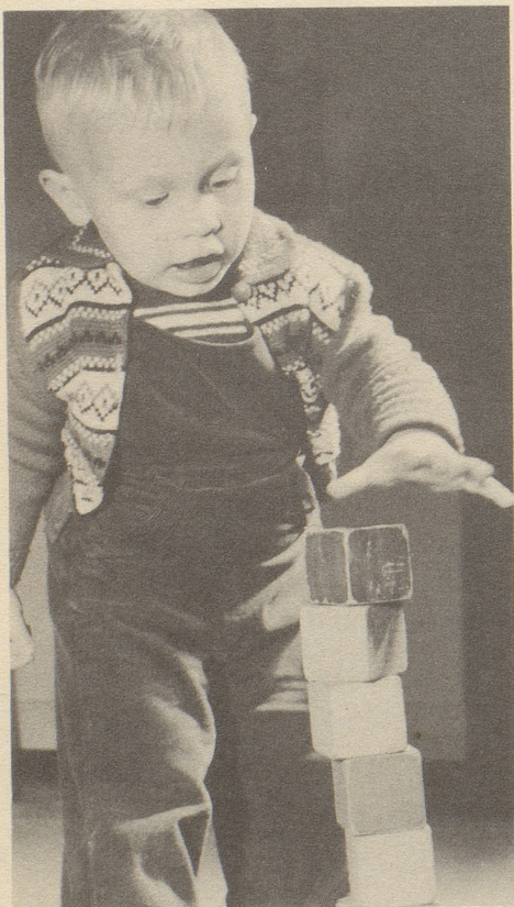
Er baut begeistert und konzentriert: einen Turm bis in den Himmel. Ovomaltine steigert die Konzentrationsfähigkeit!

Ovomaltine stärkt jung und alt, denn Ovomaltine enthält in konzentrierter Form natürliche Aufbaustoffe: Malz (gekeimte Gerste), Frischmilch und Eier mit Zusatz von Hefe, Milcheiweiss, Milchzucker und Kakao. Ovomaltine erfrischt den Geist – belebt den Körper – und mundet herrlich!