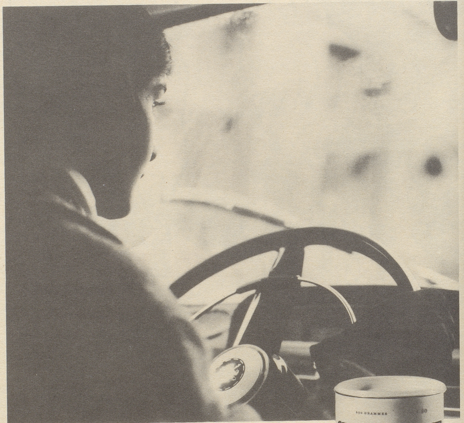
Vor längeren Fahrten trinkt sie Ovomaltine. Das verleiht ihr Wachsamkeit und bessere Konzentration.