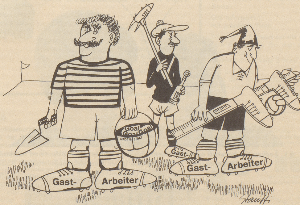
Invasion im Schweizer Fußball