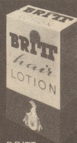
BRITT hair Lotion