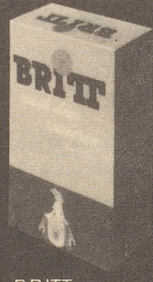
BRITT nach dem Rasieren