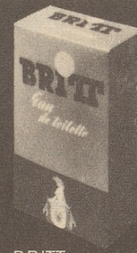
BRITT Eau de Toilette 80°