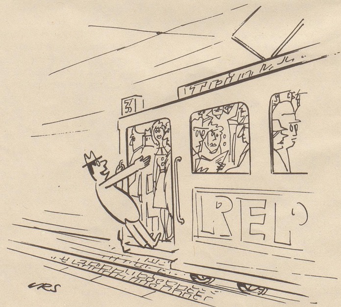
«Darf ich Sie um die Hand Ihrer Tochter bitten — wenigstens bis zum Bahnhof? »

Feuer breitet sich nicht aus, hast Du MINIMAX im Haus!