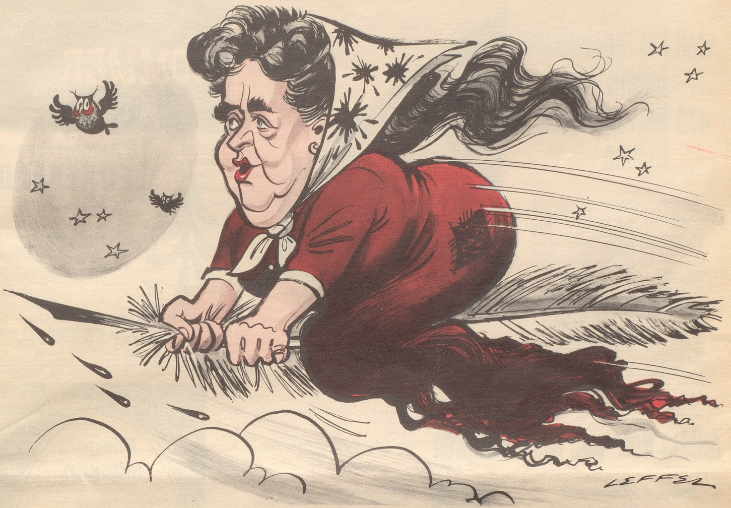
Elsa Maxwell, internationale Super-Klatschbase, 80 jährig . . .