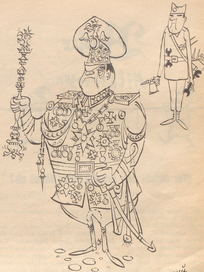
Der Machthaber und sein Adjutant