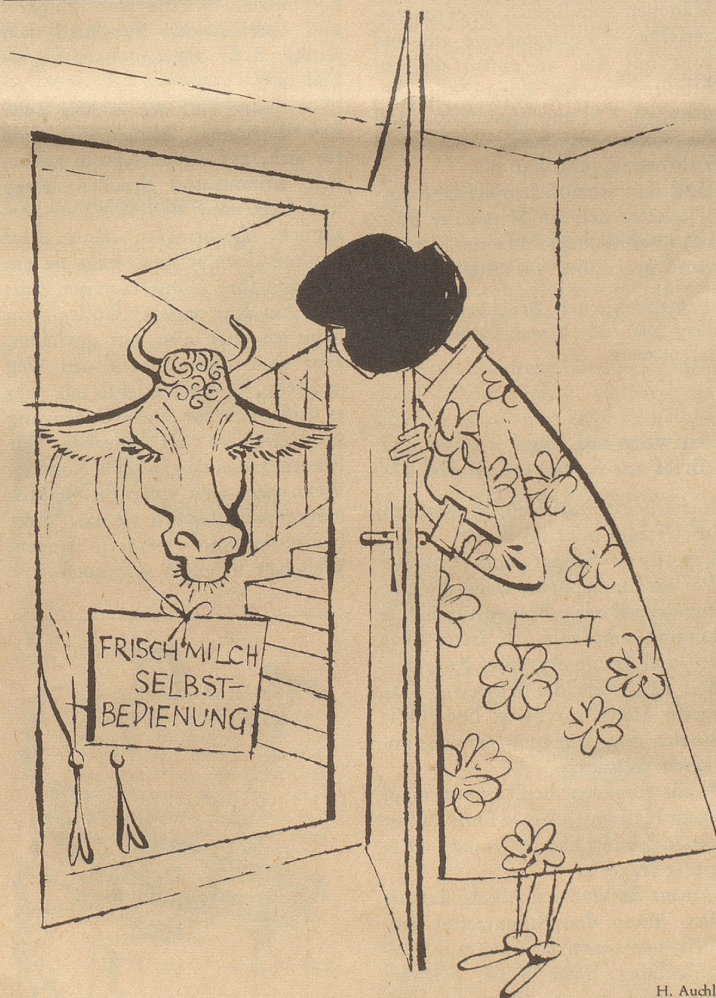
Hauszustellung der Milch in Frage gestellt