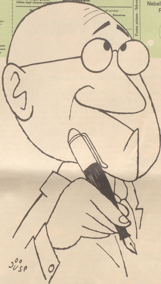
Opfer des Lochkarten-Systems