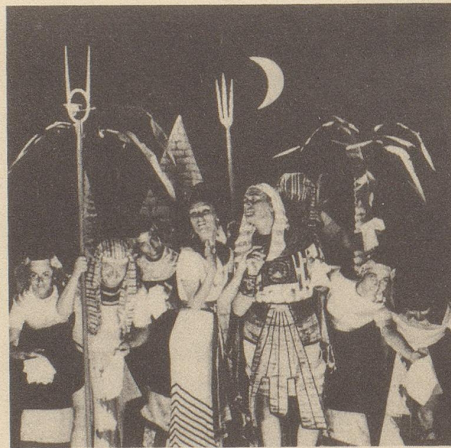
Und es gab genug Kleenex in einer einzigen Schachtel für alle 100 Schauspieler.