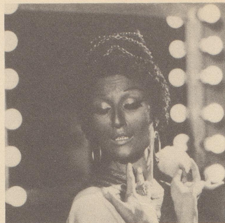
Die Primadonna litt unter Migräne...