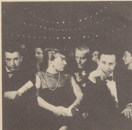
Das Publikum musste deshalb warten und warten, es wurde ganz ungeduldig!