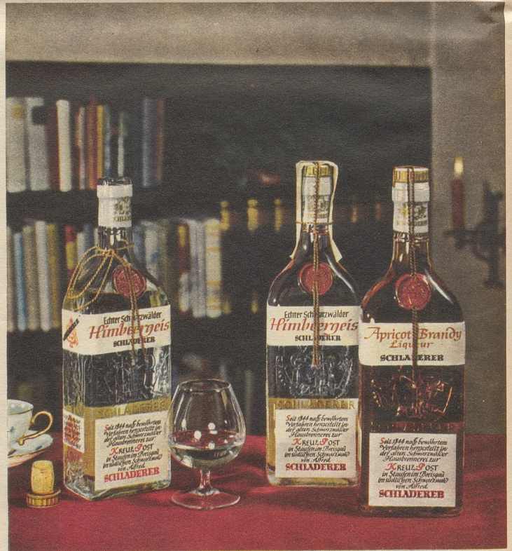
SCHLADERERS echter Schwarzwälder Himbeergeist und Apricot

Schon der Duft verbeißt höchsten Genuss — das vollkommene Aroma übertrifft Ihre Erwartungen!