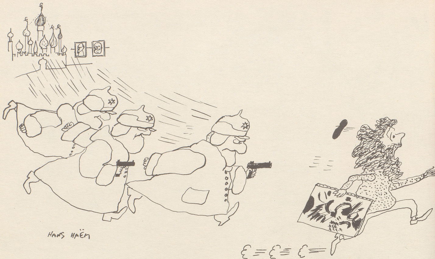
Modernistische und abstrakte Strömungen in der Sowjet-Kunst – njet!