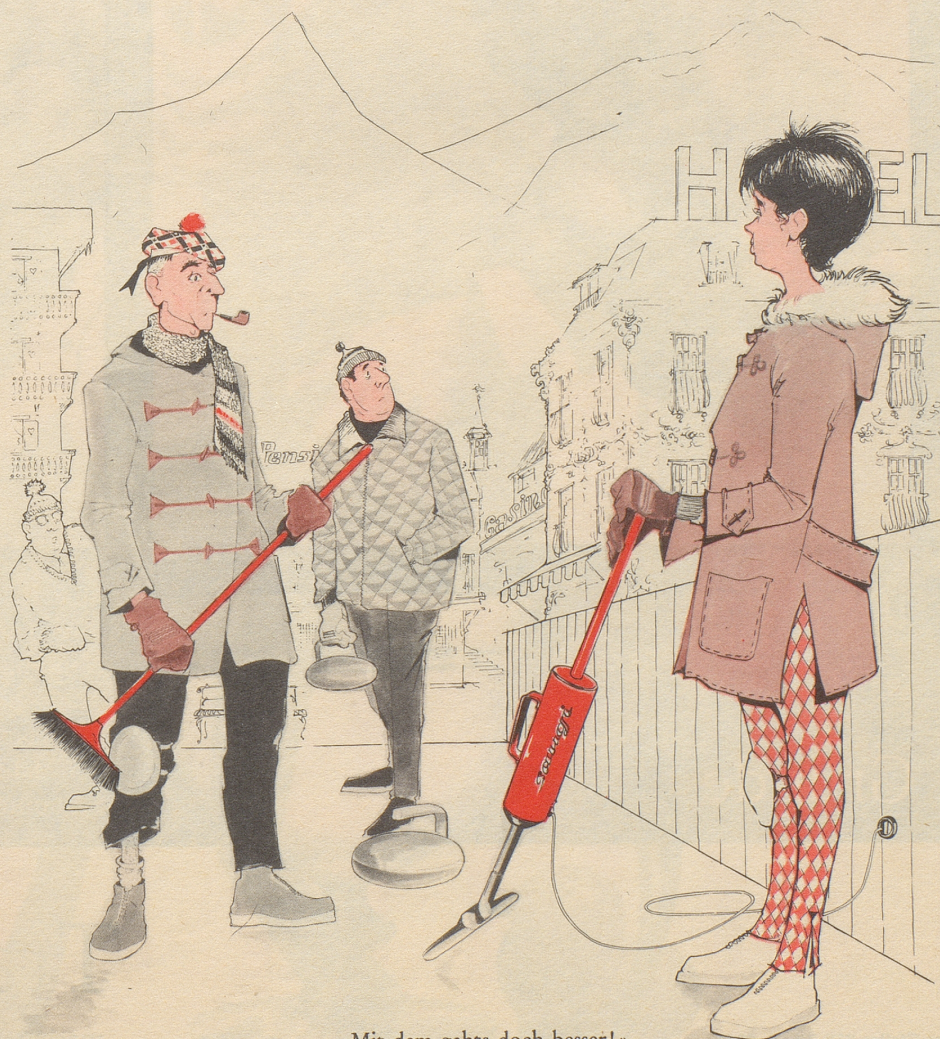
«Mit dem gahts doch besser!»