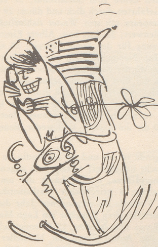
Der Draht Washington-Bonn