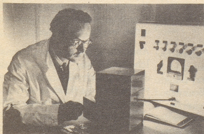
Wissenschaftlich bewiesen: Die Aufbaustoffe von Neo-Silvikrin gelangen bis in die Haarwurzeln!

Bestimmt haben auch Sie schon dies oder jenes unternommen, um den Haarausfall aufzuhalten... und das Ergebnis??? Jetzt endlich brauchen Sie nicht mehr den Mut zu verlieren, denn es gibt ja Neo-Silvikrin — die auf der ganzen Welt anerkannte biologische Haarnahrung! Die erste Voraussetzung für die Wirksamkeit eines Haarpräparates ist: Seine Wirkstoffe müssen bis in die Haarwurzeln gelangen!