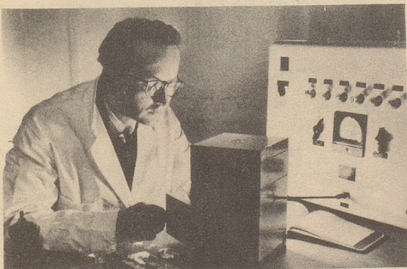
Wissenschaftlich bewiesen: Die Aufbaustoffe von Neo-Silvikrin gelangen bis in die Haarwurzeln!

Bestimmt haben auch Sie schon dies oder jenes unternommen, um den Haarausfall aufzuhalten... und das Ergebnis??? Jetzt endlich brauchen Sie nicht mehr den Mut zu verlieren, denn es gibt ja Neo-Silvikrin — die auf der ganzen Welt anerkannte biologische Haarnahrung! Die erste Voraussetzung für die Wirksamkeit eines Haarpräparates ist: Seine Wirkstoffe müssen bis in die Haarwurzeln gelangen!