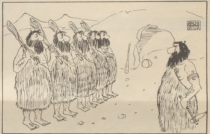
Aus der Geschichte des Militärs

«Und das soll eine Aspirantenklasse sein?! Ein Kindergarten ist das, meine Herren, ein Kindergarten!!»