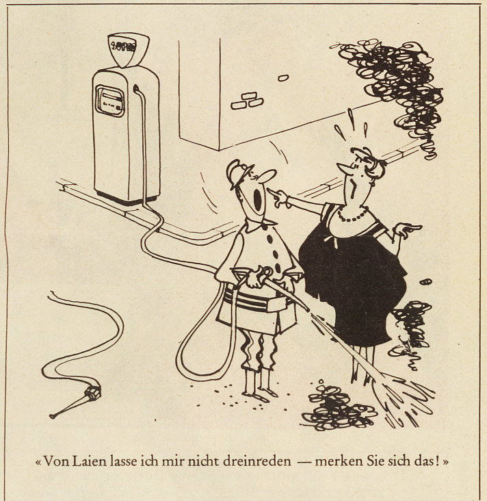
«Von Laien lasse ich mir nicht dreinreden — merken Sie sich das!»