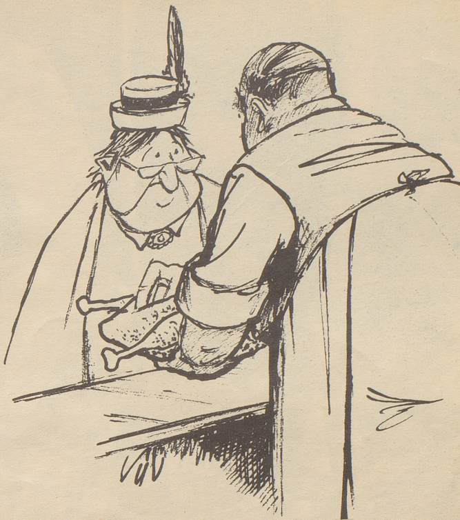
«Es ganz es prima Supp ehuhn, Frau Blööterli — schpeziell mit Bulionwürfel gfuetteret!»

Nach der Mona-Lisa, die letztes Jahr mit so großem Erfolg eine Tournee in Amerika absolvierte, senden die Franzosen diesmal die Venus von Milo auf die Reise, sie soll sogar nach Tokio kommen. Wer diese beiden Kunstwerke noch nie von Auge gesehen hat, tröstet sich mit den orientalischen Kunstwerken, die in Zürich an der Bahnhofstraße 31 ausgestellt sind: mit den herrlichen Orientteppichen im Teppichhaus Vidal!