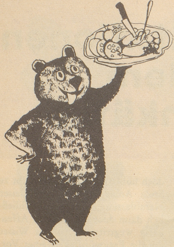
Ueli der Schreiber: