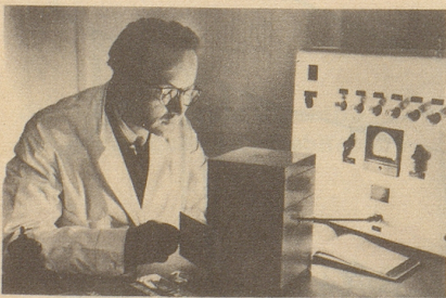
Wissenschaftlich bewiesen: Die Aufbaustoffe von Neo-Silvikrin gelangen bis in die Haarwurzeln!

Bestimmt haben auch Sie schon dies oder jenes unternommen, um den Haarausfall aufzuhalten... und das Ergebnis??? Jetzt endlich brauchen Sie nicht mehr den Mut zu verlieren, denn es gibt ja Neo-Silvikrin — die auf der ganzen Welt anerkannte biologische Haarnahrung! Die erste Voraussetzung für die Wirksamkeit eines Haarpräparates ist: Seine Wirkstoffe müssen bis in die Haarwurzeln gelangen!