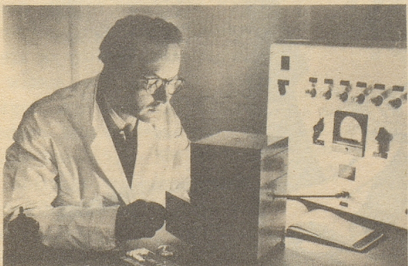
Wissenschaftlich bewiesen: Die Aufbau- stoffe von Neo-Silvikrin gelangen bis in die Haarwurzeln!

Bestimmt haben auch Sie schon dies oder jenes unternommen, um den Haarausfall aufzuhalten... und das Ergebnis??? Jetzt endlich brauchen Sie nicht mehr den Mut zu verlieren, denn es gibt ja Neo-Silvikrin — die auf der ganzen Welt anerkannte biologische Haarnahrung! Die erste Voraussetzung für die Wirksamkeit eines Haarpräparates ist: Seine Wirkstoffe müssen bis in die Haarwurzeln gelangen!