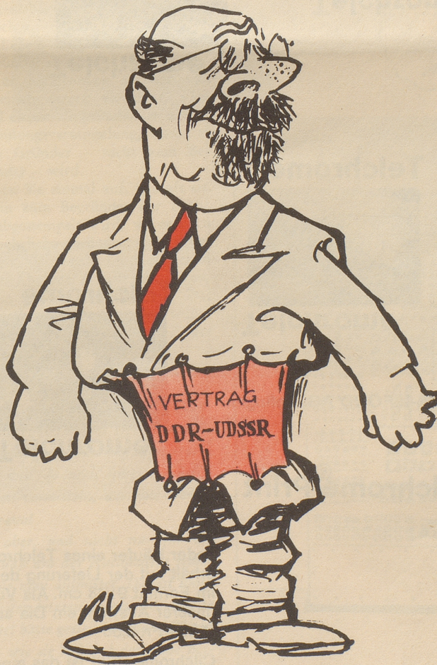
Ulbricht: «'s neue Gorsedd baßt wie anjeggossen!»

In Kopenhagen schlief Chruschtschow im selben Hotelbett, in dem kurz zuvor schon einer der Beatles geschlafen hatte. Wollten die Dänen dem Russen nicht lieber Hans Christian Andersens Bett zur Verfügung stellen, jenem anderen großen Märchenerzähler?