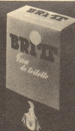
BRITT Eau de Toilette 80°

BRITT hair Lotion und BRITT hair Cream verhindern Schuppen und Haarausfall, schenken dem Haar einen natürlichen, anziehenden Glanz, erlauben ein leichtes Frisieren und machen die Frisur lange haltbar. BRITT bietet alles, was man von modernen Haarpflegemitteln erwarten kann.