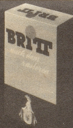
BRITT nach dem Rasieren