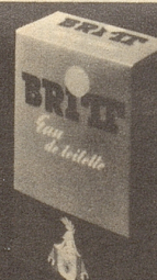
BRITT Eau de Toilette 80°

BRITT hair Lotion und BRITT hair Cream verhindern Schuppen und Haarausfall, schenken dem Haar einen natürlichen, anziehenden Glanz, erlauben ein leichtes Frisieren und machen die Frisur lange haltbar. BRITT bietet alles, was man von modernen Haarpflegemitteln erwarten kann.