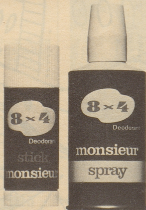
Stick monsieur Fr. 3.60 Spray monsieur Fr. 6.60