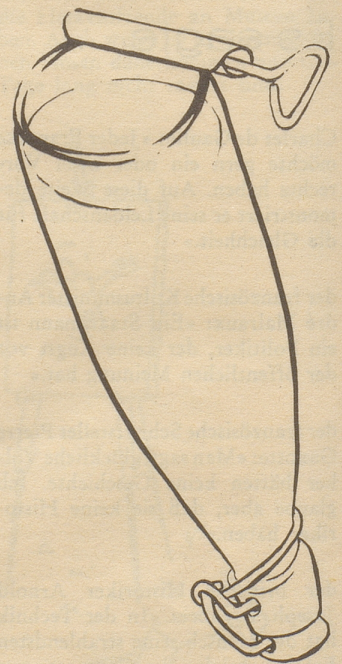
Hundstage-Bieridee von H. J.